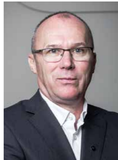
GYULA PORGA Bürgermeister — Veszprém